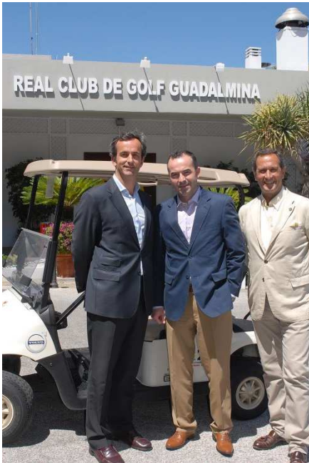
Posando frente al Real Club de Golf Guadalmina

El Real Club de Golf Guadalmina, decano de los Clubes de Golf en la costa del Sol, se pone nuevamente a la vanguardia de la gestión, mediante la firma de un acuerdo de patrocinio con la empresa VYPSA, concesionaria de la marca de automóviles VOLVO, de reciente implantación en la provincia de Málaga, con exposición y venta en Málaga Capital y en Marbella.